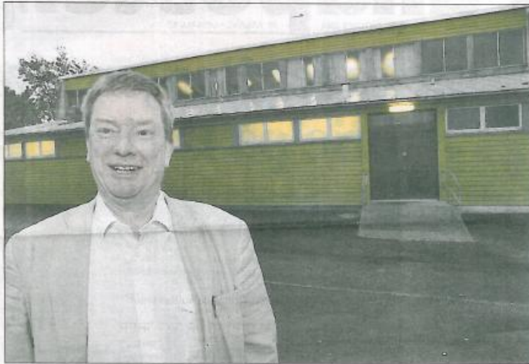
NÆR MÅLSTREKEN Hop basketballklubb trenger fem millioner kroner for å bygge en baskethall i stedet for en volleyballhall, som er mye mindre. Dersom klubben ikke klarer å skaffe midlene, så bygges volleyballhallen ved Hop ungdomsskole neste år. Da er løpet kjørt for basketballklubben.

Selv om det mangler fem millioner, så blir det i realiteten bare tre. To av dem får kommunen tilbake i form av spillemidler. Ved bygging av en volleyballhall, så får kommunen tilbake rundt fire millioner kroner. Ved bygging av en baskethall, vil kommunen få tilbake rundt seks mill. To millioner mer enn den de