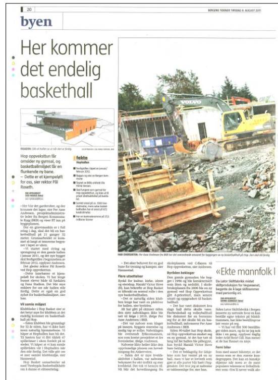
Nå kommer den!: Ny baskethall på Hop forventes ferdig våren 2012. Bildet er en faksimile fra Bergens Tidende 9. august 2011.

Hop BBK forventer at ny idrettshall blir klar i løpet av våren 2012, og at klubben får det aller meste av kveldstiden til disposisjon for basketball. Videre håper klubben at vi kan utvikle en flott åpning av hallen i første halvår av 2012, og at den nye Hophallen blir et viktig samlingspunkt for hele klubben.