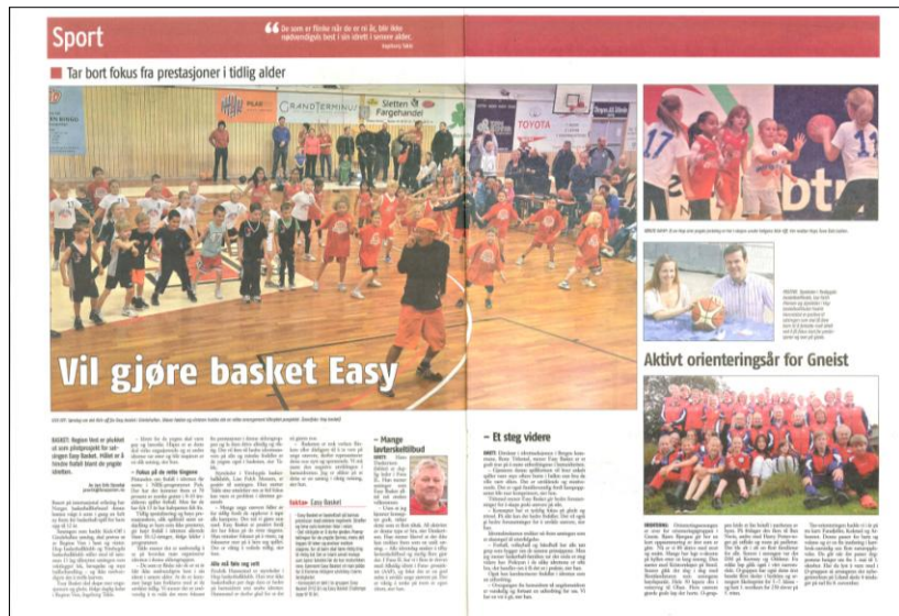
EasyBasket på Vestlandet: Med hele seks lag, er Hop BBK den største klubben innen EasyBasket i Norge. Bildet er en faksimile fra Fanaposten 4. november 2011.

EasyBasket er navnet på et nytt basketballkonsept for de aller yngste spillerne. For barn opp til U12 skal man spille etter egne regler som er mer tilpasset de aller yngste. Spillerglede, utfoldelse og bevegelse erstatter prestasjoner, scoringer og strenge regler. Flere land, blant annet Sverige, har god erfaring med EasyBasket, og Norges basketballforbund har bestemt at Region Vest skal være pilot i Norge for inneværende sesong. Kickoff for EasyBasket i Norge gikk av stabelen i Gimlehallen i oktober 2011, og Hop BBK er den klubben som har meldt på flest lag. Hele seks lag fra Hop BBK gjør oss til Norges største EasyBasket-klubb! Region Vest gjennomførte åpent informasjonsmøte om EasyBasket i begynnelsen av oktober, og Hop BBK var den klubben med sterkest representasjon.